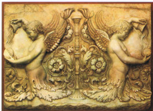
Museo Pablo VI. Vaticano. Genios Alados. Bajorrelieve procedente del Foro Trajano. Óleo sobre táblex (73 x 100 cm)

muy gratificante porque trabajar con el arte es algo excepcional, tienes la suerte de comprar y vender cosas que te gustan y que son bonitas. Además, debes estar estudiando cada día, ver piezas nuevas y clasificar, hay que mantenerse al día porque, además, el mercado asiático supone acercarse a una